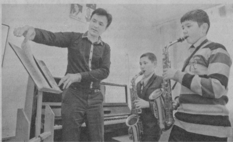
Асосийси, ҳар бир ёш билан ишлайётган ўқитувчи ва тарбиячилар ўз ишларига сидқидилдан ёндашиб фаолият юртимокдалар. «Ватан оиладан бошланади», «Саломатлик бойлигим», «Оила муқаддас даргоҳ», «Келажимни ўзим яратаман» каби маънавий-маърифий тадбирларнинг мунтазам равишда

Халқ таълими вазирилиги тасаруфидоги Республика ихтисослаштирилган мусика ва санъат академик лицейида ўқувчиларнинг ўқиш ва иланишлари, қобилиятларини янада шакллантиришлари учун барча шароитлар яратилган. Муассасада битта ёпиқ спорт зали, ошхона, 36 та фан тўрақлари, кутубхона ўқувчиларга самарали хизмат кўрсатмоқда.