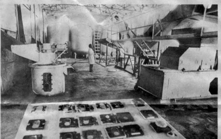
Янгиқўрғон районидagi «Гудшан» давлат хўжалигининг сохиборлари жорий йилда 700 гектар ерлар мўл узум ҳосили эшитиришди. Унинг 400 гектар экинини винобон навлар ташкил этади. Шу боис хўжалик раҳбари ташаббус билан вишулук қуришга киришганлиги. Уч ойлик тинимсиз меҳнатдан сўнг маҳсулотни қайта ишловчи цех ишга туширилди. Натижада ҳосил ипишиб етилгандан бунён ерда 300 тонна узум

этиш учун қандай тайёрларлик қўрилганлиги, жиноят режасини у содир этилгунга қадар қандай амалга оширилганлиги тўғрисида мафассал маълумот берди. Хуқуқни муҳофаза қилиш органлари ходимларининг аниқ ҳаракат қилишлари туфайли жиноятчилар олдини олишга муваффақ бўлинди. Бироқ, маълумки, Шмонов хар қалай мулккага олмасдан бўлса, ички марта ўз узишга уларди. 8 июль — кун ССЖН Бош прокуратурининг ўринбосари Я. Дзенинскан Шмоновни намоққа олиш учун рўхсат олинди.