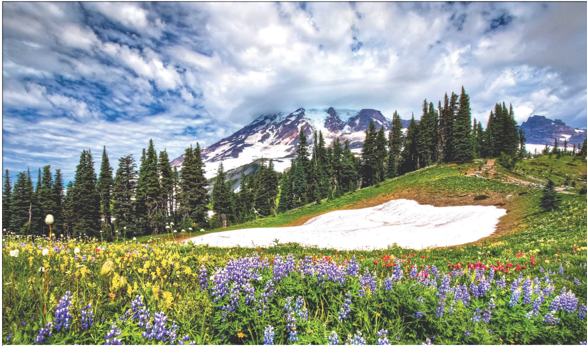
Бир ўлкаки, қишларида шивирлар баҳор!