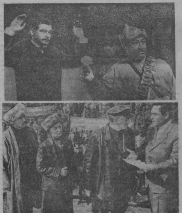
СУРАТДА: «Инқилоб чавандозлари» фильмидан кадрлар.

Ниҳоят яқин оғиз ҳаммуаллифларим ҳамда. Уларнинг қўлини билан аввало, унинг ҳам ҳамкорлик қилган эдик. Уларнинг орасида «Осе» устида бўрон» да бирга ишлаганлар ҳам бор. Юқорида айтганимдек, фильм сценарийини кинодраматург Михаил Мелкумов билан ҳамкорликда ёздик.