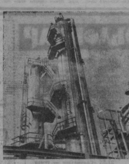
СУРАТДА: Болгария саноятининг гиганти — Броти шаҳридаги химия комбинатининг ижроиланган. Бу комбинат венгер ва совет муҳасислари ёрдамида қурилган бўлиб йилга юз минглаб тонна нарбами, аминия ва бошқа хил маҳсулотлар ишлаб чиқаради.