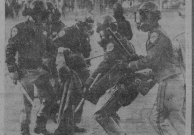
АҚШда ёшларнинг ирчиликни қарши нураши давом этипти. Берли шаҳридаги Калифорния университети территориясида студентлар бир ойдан ортиқ вақтдан бери ўзув юртларига қабул қилишда ирчи нақси. тишларни тўхтатиш шiori остида кураш олиб бормоқдалар. СУРАТА: полиция таёк ва и99дан ёш оқишувчи ёш ёрдимида Кали-форния университети студентларини жазоламоқда.

ТЕХРОН. Осё ва Африка мамлакатларининг Тошкентдаги Биринчи ҳақдиро кинофести-валида кўрсатишган Эроннинг ик-ки кинофильми мукофотланган-лигига бағишланиб СССРнинг Эрондаги элчихонаси клуби-да кеча ўтказилди. Залга келган мамлакат маданият ва санъат ар-боблари, таниқли кинематограф-чилар Эрон ва чет эл журналист-лари Эрондаги Совет элчихонаси-да матбуот атташеси А. Н. Сироев-нинг «Мозандарон шери» ва «Европалик келин» деган Эрон фильmlари Тошкент фестивали-нинг фахрий дипломлари билан мукофотланганлиги тўғрисидаги ахборотини самимий кутиб олди-лар. Ана шу фильmlарни яратган режиссерлар билан ижрокчилар Эроннинг ёш кино санъатига эъ-тибор билан қаратилгани учун фестиваль ташкилотчиларга са-мимий миннатдорчилик изҳор қилдилар. Кеча охирида меҳмон-ларга диплом билан тақдирланган фильmlардан парчалар кўрсати-ди. (ТАСС).