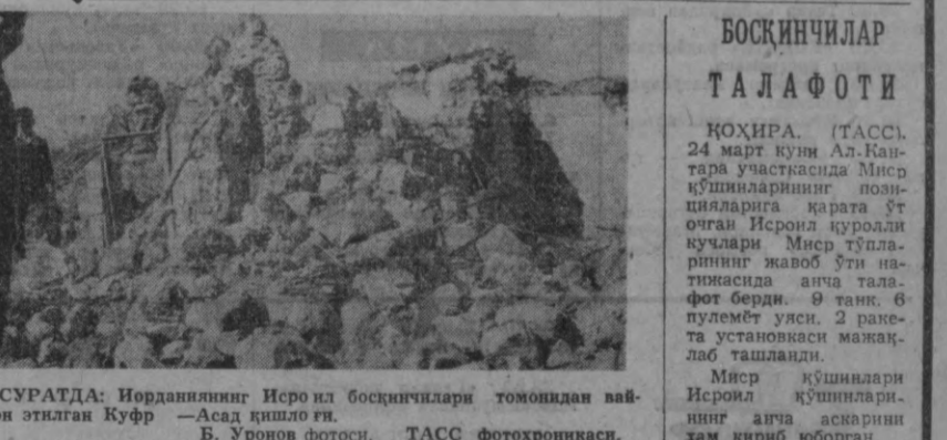
СУРАТДА: Иорданиянинг Исроил босқинчилари томонидан қайрон этилган Куфр —Асад қишлоғи.

узоқ турган орган билан алмаштирилади. Франция Коммунистик партияси ҳозирги ҳукуматнинг мамлакат олдида турган катта проблемаларини ҳал этишга қорид эришгани таъкидлади. Францияда яйрик капиталистик компанияларнинг ҳукмронлигига чек қўйадиган илҳол сибсий ва иқтисодий демократия режимини аут-