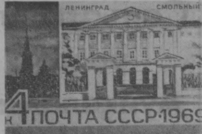
СУРАТДА: СССР алоқа министрлиги чиқарган янги почта маркалари — «Ленинград, Смоленский» ва «Разлив, В. И. Ленин чайласи».