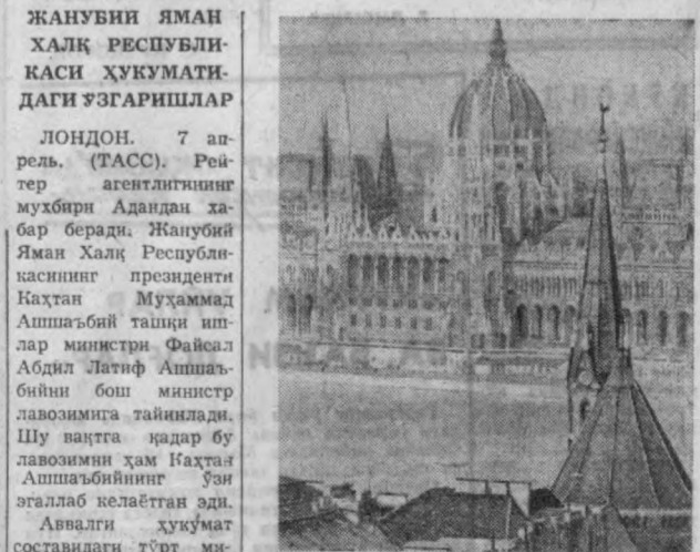
БУДАПЕШТ. Дунай дарёсининг Пешт қирғоги-да Венгрия парламентининг азин биноси қад кў-тариб турибди. Бу ерда ВХР Давлат неғмаси-нинг мажлислари ўтади.

НЬЮ-ЙОРК, 7 апрель. хабар беради: Эрон (ТАСС). ЮПИ агентлиги-нинг мухбири Истамбул-дан хабар беришича, келтирган тошқин нати-жасида 20 ишчи ҳалок бўлган. Вьетнамнинг 284 кишидаги 10 мингдан ортиқ уй вайрон бўл-ган. Техрон билан ҳаёт-нат юз берган район-роқ уртасида темир йўл ва автомобиль алоқаси узилди. Азият кеңдан қишлоқлардаги аҳолига ердан кўрсатиш-ва уларни кўчириш бо-расида чоралар кўрил-ди.