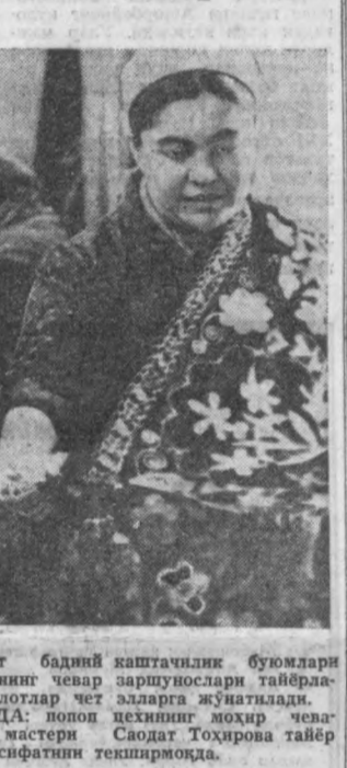
Тошкент бадий кастачилик буюмлари фабрикасининг чевар зардушлари тайёрлаган маҳсулотлар чет элларга жўнатилади.

Ўйинчоқ фабрикасининг коллективи Москва-Сортировочная депосида бошланган биринчи коммунистик шанбаликнинг 50 йиллиги кунини — 12 апрелда амалга оширилган бир талай тадбирларни белгилаб олди.