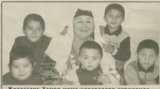
Жиззахлик Ҳамро момо неваралари қуршовида.

миз тағига ахлат тўкаётганини кўриб қолиб тергов қилгандилар. «Онам номозшомдан фойдаланиб, бирон кишининг ҳовлиси олдига тўкиб кела қол», дегандилар дебди. "Кимдир кечаси деворимнинг тағига ахлат тўкиб кетаяпти", деб нолиб юрган кўшнилари кўз олдимга келиб юрагим увишди. Битта нотўғри қадам, биргина ноҳўя сўз болани йўлдан чиқариши, мурғак қалби бутунлай майиб бўлиб қолиши мумкин экан. Хурматли опа-сингиллар, бола тарбиясига масъулият билан ёндошайлик! Ёшларимиз тарбияси-