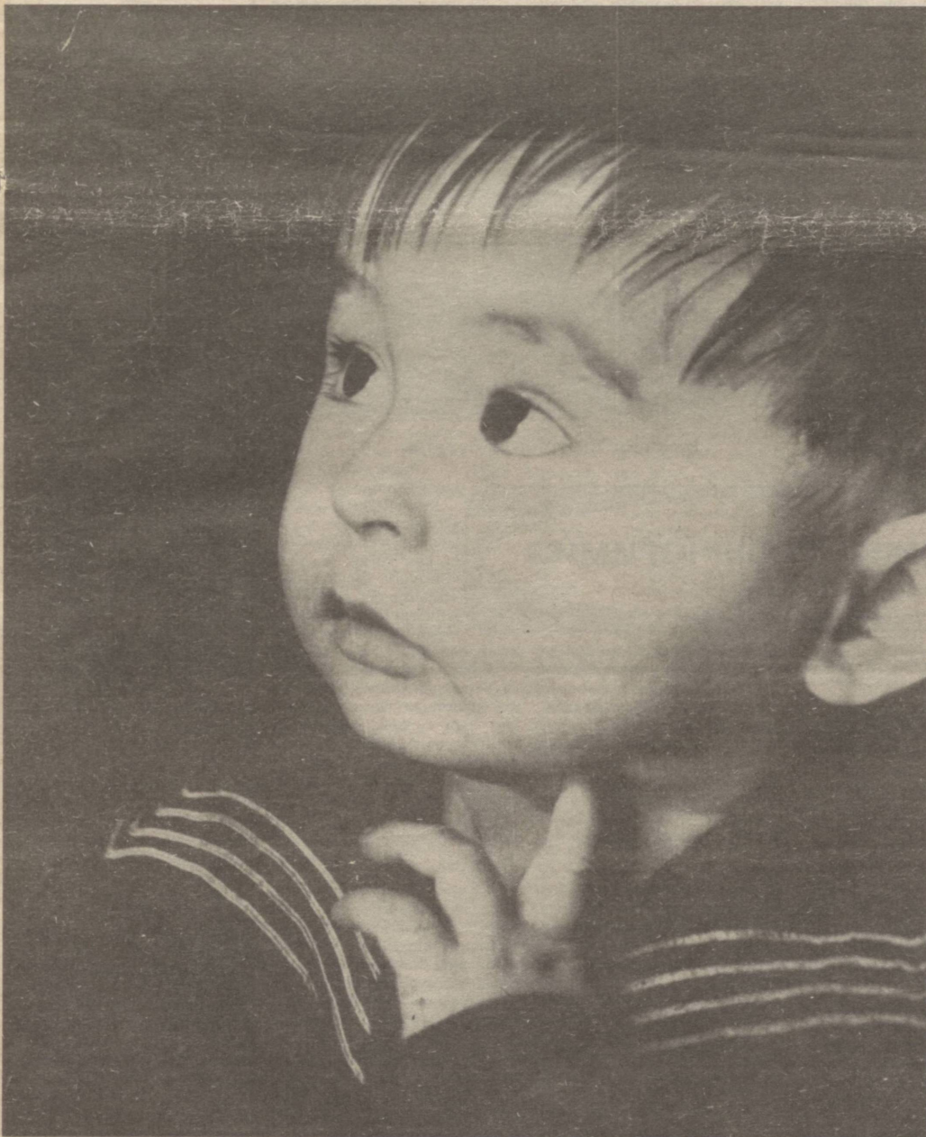
Оббо! Ойим уйда бўлмагандан кейин шуда, дадам овқат қилишнйам билмайди...