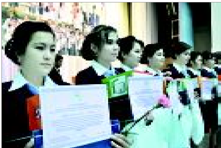
(Давоми. Боши 1-бетда).