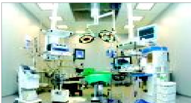
40-модда. Ҳар бир инсон малакали тиббий хизматдан фойдаланиш ҳуқуқига эга.