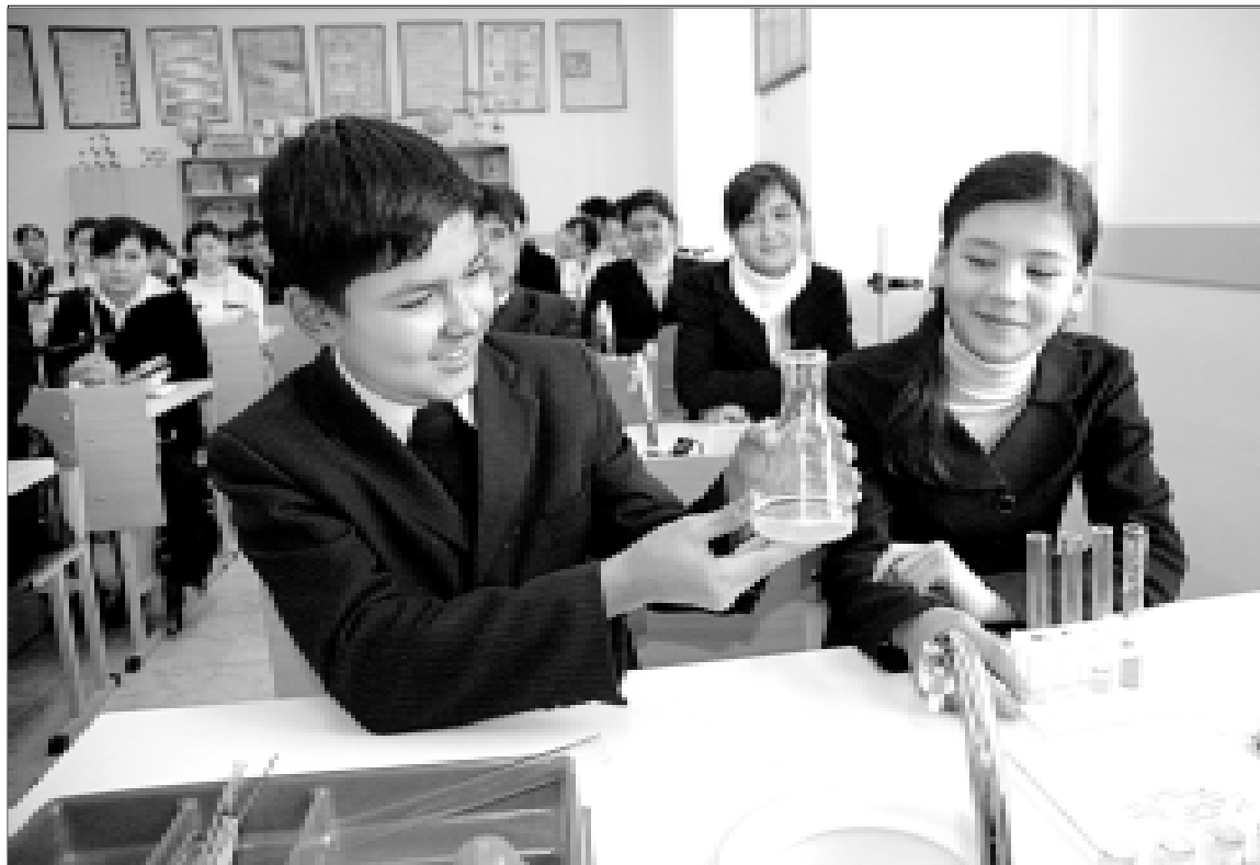
Каждый день постигая новое, мы готовим себя к вступлению во взрослую жизнь.

Агар Сиз обуна бўлган ҳудудда газетанинг кечикиб бориш ҳолатлари кузатилса, тахририятнинг қуйидаги рақамларига мурожаат қилишингиз мумкин: (8371) 233-13-22, 233-57-73.