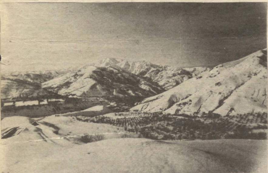
ТОҒЛАР ҚОРГА БУРКАНДИ