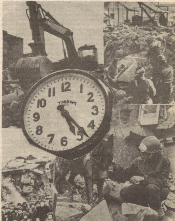
СОАТ КАПГИРИ ОФАТ ЮЗ БЕРГАН ДАҚИҚАЛАРИНИ КЎРСАТИБ ТУРИБДИ.

Азиз АБДУВАЛИ, «Оила ва жамият»нинг махсус мухбири