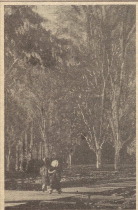
Х. Саидов сурати