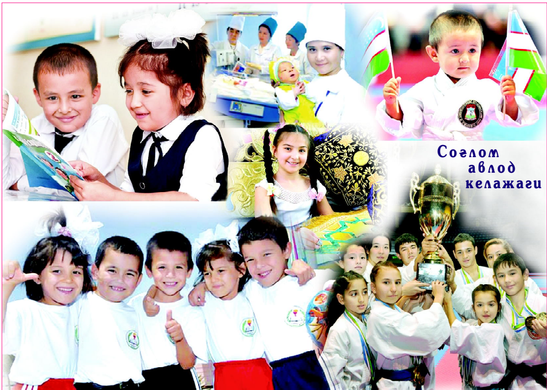
Соғлом авлод келажаги

латимиз инсон ҳуқуқлари, хусусан бола ҳуқуқларига оид кўплаб халқаро битимларни имзолади. Жумладан, «Бола ҳуқуқлари тўғрисида»ги Конвенция, «Болаларни омон асраш, ҳимоя қилиш ва камол топтиришни таъминлаш тўғрисида»ги умумжаҳон декларацияси, «Болаларни бошқа мамлакатга ўғирлаб олиб кетишнинг фуқаролик жиҳатлари тўғрисида»ги Гаага конвенциясининг ратификация қилинган юртимизда болалар манфаатларини ҳимоя қилиш давлат сиёсати даражасига кўтарилганининг ёрқин далилидир. «Инсон ҳуқуқлари умумжаҳон декларацияси»нинг 25-моддасида «Оналик ва болалик алоҳида гамхўрлик ва ёрдам ҳуқуқини беради. Барча болалар никоҳда ва никоҳсиз туғилганлигидан қатъи назар, бир хил ижтимоий ҳимоядан фойдаланиши керак» дея таъкидланган. Шунингдек, БМТнинг «Иқтисодий, ижтимоий ва маданий ҳуқуқлари тўғрисида»ги халқаро пактида «Барча болалар ва ўсмирларга ҳеч бир камситишсиз, оилавий келиб чиқиши ёки бошқа белгиларидан қатъи назар, алоҳида ҳимоя чоралари