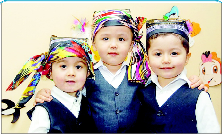
– Катта бўлсак, Ўзбекистон доврўгини дунёга ёямиз!