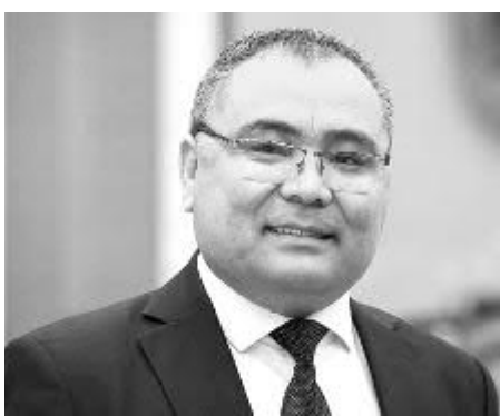
Иброҳим АБДУРАҲМОҲОВ, инновацион ривожланиш вазири, академик

САХОВАТЛИ ОНА ЗАМИНИМИЗ ТУРФА МАЪДАНЛАРГА БОЙЛИГИНИ ҲАММА ЭЪТИРОФ ЭТАДИ. БИЗДАГИ МАВЖУД ИМКОНИАТЛАРГА КАТТА ҲАВАС БИЛАН ҚАРАЙДИ. БУ БЕЖИЗ ЭМАС. БИРГИНА МИС РУДАСИНИ ҚАЗИБ ОЛИШ ҲАЖМИНИ ОШИРИШ ОРҚАЛИ КИМЁ, АВТОМОБИЛСОЗЛИК САНОАТИДА ЮҚОРИ ЎСИШГА ЭРИШИШ МУМКИН. ЎЗ НАВБАТИДА, БУ ҚЎШИМЧА ҚИЙМАТ ОРҚАЛИ МАМЛАКАТИМИЗ АҲОЛИСИНИ ЯНГИ МАБЛАҒ БИЛАН ТАЪМИНЛАШ ИМКОНИНИ БЕРАДИ. ШУ МАЪНОДА, ПРЕЗИДЕНТИМИЗНИНГ ЖОРИЙ ЙИЛ 24 ИЮНДАГИ "КОН-МЕТАЛЛУРГИЯ САНОАТИ ВА УНГА БОҒЛИҚ СОҲАЛАРНИ РИВОЖЛАНТИРИШ БЎЙИЧА ҚЎШИМЧА ЧОРА-ТАДБИРЛАР ТЎҒРИСИДА"ГИ ҚАРОРИ ТАРИХИЙ АҲАМИЯТГА ЭГА БЎЛГАНИНИ ТАЪКИДЛАШ ЖОИЗ.