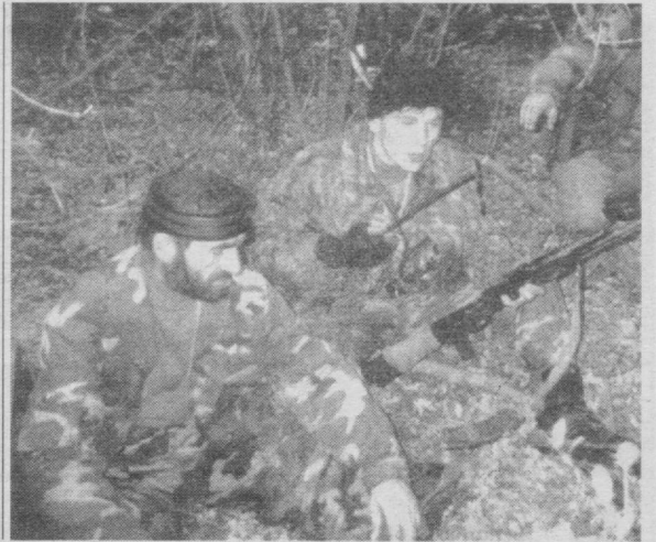
Қ ў ш м а Штатлар эса Усома бин Ладинга мадад бериб туришда давом этади. Уни қуроласлаха билан таъминлайди, мамлакат худудиди

айтганда «сербларнинг шахдини қайтариш» вазифасини бажаришга киришилади. Ладиннинг жангчилари боснийлик мусулмонлар қаторида жангга кириб, Босния-Герцоговинани серблардан «тозалаш»ни бошлаб юборади. Шу билан бир вақтда жангариларнинг бир гуруҳи албан сепаратизми бош кўтарётган Косовода фаолиятини бошлайди.