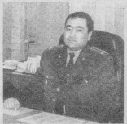
Баҳодир ДЕҲҚОНОВ, Ўзбекистон Республикаси Бош прокурори ўринбосари — Республика Ҳарбий прокурори

1992 йилнинг 14 январида Ўзбеки- стон Республикаси Олий Кенгаши со- биқ Иттифоқнинг парокандаликка юз тутиши натижасида вужудга келган бир шароитда юртимиз худоидида жойлаш- ган ҳарбий қисм- лар, ҳарбий ўқув юртлари ва бошқа ҳарбий тузилма- ларни Республика хукукий тасарруфи- га олиш тўғрисида тарихий қарор қабул қилди. Шу куни мамлақати- мизнинг бўлажак Қуролли Кучларига тамал тоши қўйил- ди.