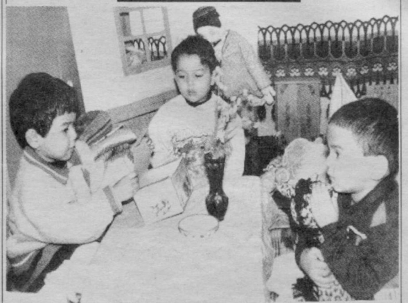
Кўғирчоғинг берсанг, қутича ясаб бераман...