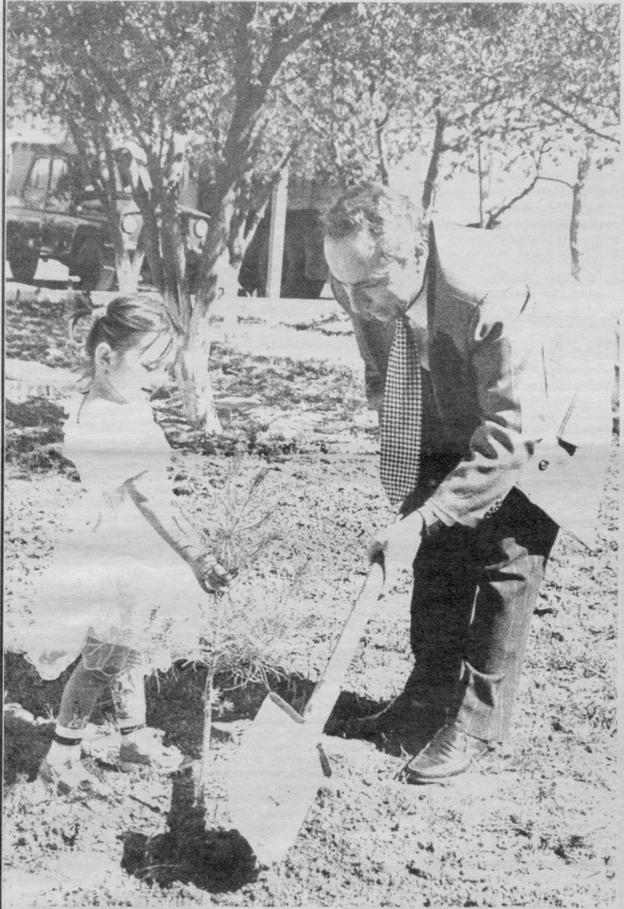
— Ҳадемай бу ниҳол ҳам сен каби униб-ўсади, қизим!

Ҳайъат мажлиси муҳокама этилган масалалар юзасидан тегишли қарорлар қабул қилди.