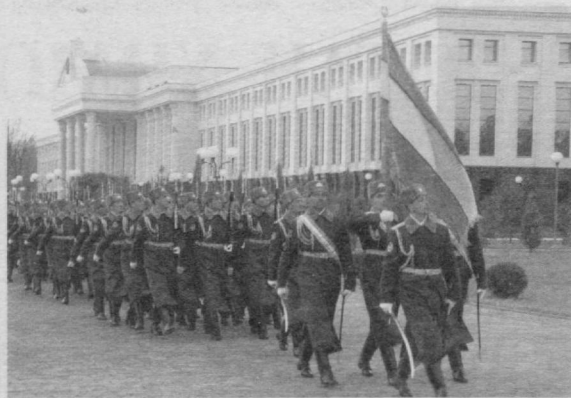
Шўхрат УЗАКОВ, Ўзбекистон Республикаси Бош прокурорининг ўринбосари- Республика Ҳарбий прокурори, генерал майор