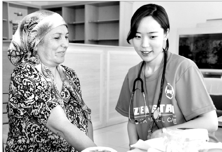
Андижонда Жанубий корейлик бир гуруҳ тажрибали шифокорлар томонидан тиббий кўрик ўтказилди.

Президентимиз раҳнамолигида соғлиқни сақлаш тизимида ислоҳ қилиш жараёнида тиббий хизмат сифати ва самардорлигини юксалтириш, тиббий муассасалар моддий-техник базасини мустаҳкамлаш, халқаро тиббиёт муассасалари билан ҳамкорликни кенгайтиришга алоҳида эътибор қаратилмоқда. “Соғлом авлод учун” халқаро хайрия фонди оналар ва болалар саломатлигини муҳофаза қилиш бўйича бир қатор лойиҳаларни амалга оширмоқда. Шулардан бири халқаро ҳам-