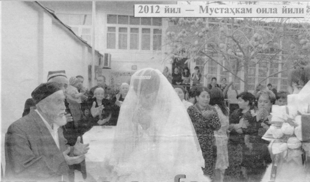
2012 йил — Мустаҳкам оила йили

Хонадонингизда тўй бўлса, қандоқ яхши! Чор-атроф шодиёна тус олади. Элу элдошинг, қавму қариндошинг, қўни-қўшининг сенинг бир неча кунлик қувончингга шерик бўлишади. Бу шодликлар, бу кулгулар ота-онанинг самимий розилигисиз, оқ фотиҳасисиз татимайди, албатта.