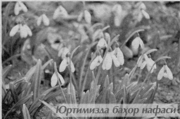
Юртимизда баҳор нафаси

Матбуот анжуманида журналистларни қизиқтирган саволларга жавоблар қайтарилди.