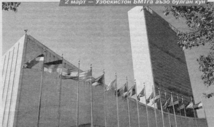
"Биз, Бирлашган Миллатларнинг халқлари, инсоннинг асосий ҳуқуқлари, инсон шахсининг қадр-қиммати, эркаклар ва аёлларнинг тенг ҳуқуқларига ҳамма катта ва кичик миллатларнинг ҳуқуқий тенглигига ишончимизни яна бир қарра тасдиқлаб, БМТ уставини қабул қилишга ва БМТни тузишга қарор қилдик", дейилади БМТ уставининг муқаддимасида.