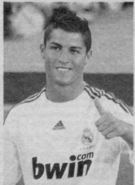
Спорт хабарларини Максудали КАМБАРОВ тайёрлади

«Реал» футболчиси Криштиану Роналду эса учинчи ўринда бормоқда. Португалиялик футболчи йилга 29,2 миллион евро топади. Шулардан 15,5 миллион евро унга майдон ташқарисидagi фаолияти ортдан келади.