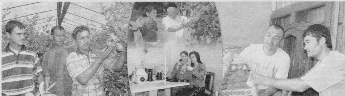
Давоми. Бошланиши 1-бедра

М аълумки, сўнгги йилларда Президентимиз ва ҳукумат томонидан давлат идораларининг тадбиркорлик фаолиятига ноқонуний аралашувини катъий чеклаш, уларнинг ҳуқуқий ҳимоясини таъминлашга қафолатлар берувчи бир қатор муҳим аҳамиятга эга бўлган меъёрий-ҳуқуқий ҳужжатлар қабул қилинди.