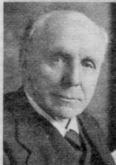
Роберт Сесил — 1906 йилдан

англиялик ҳуқуқшунос сифатида танилган эди. Унинг асосий йўналиши тинчликпарварлик, халқаро ҳуқуқ йўналиши бўйича фаолият олиб борган. У 1919 йилда Париж шаҳрида бўлиб ўтган тинчлик анжуманида ўз мамлакатининг вакили сифатида иштирок этиб, Миллатлар Лигасида қўрилган масалаларнинг тарафдори бўлган. Р.Сесил бир қанча орден, медал ва халқаро мукофотлар совриндори бўлган. Жумладан, 1923 йилда Челвуд виконти нишони ва Кавалер ордени соҳиби эди. 1956 йилдан Бирмингем университетининг ҳазинабонни лавозимига хизмат қилган. 1924 йилда Вудро Вильсон Фонди мукофотининг соҳиби. Шунингдек, Эдинбург, Оксфорд, Кембриж, Манчестер, Ливерпуль, Абердин, Принстон, Колумбия ва Миср университетларининг фахрий ёрликлари соҳиби бўлган.