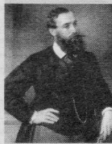
Чичерин Борис Николаевич —

машҳур файласуф ва ҳуқуқшунос. 1828 йили Томбов шаҳрида туғилган. 1868 йилда Москва университетининг ҳуқуқшунослик фанлари доктори, профессор илмий унвонига сазовор бўлган. Чичерин олим сифатида давлат ва ҳуқуқ тизимини бир-бирига боғлаб, илмий изланишлар олиб борган. Унинг: "Россия ҳуқуқининг тарихиди тахрибалари" (1859); "Халқ ҳокимияти хусусида" (1899); "Давлат ва хусусийлик" (2 томлик, 1882-1883); "Ҳуқуқ фалсафаси" (1901); "Давлат фанлари курси" (3 томлик, 1894, 1896, 1898); "Сиёсатга доир саволлар" (1903) каби бир қатор китоблари чоп этилган. У ўзининг барча илмий асарлари ва тадқиқотларини асосан сиёсат, давлат, суд ҳокимияти ва ҳуқуқий асосларнинг изчиллигига бағишлаган. Чичерин давлат ҳокимиятини асосан: 1) сиёсатчилар қатлами; 2) қонун; 3) эркинлик; босқичларгина бирлаштириши мумкин деган фикрларини илгари сурган.