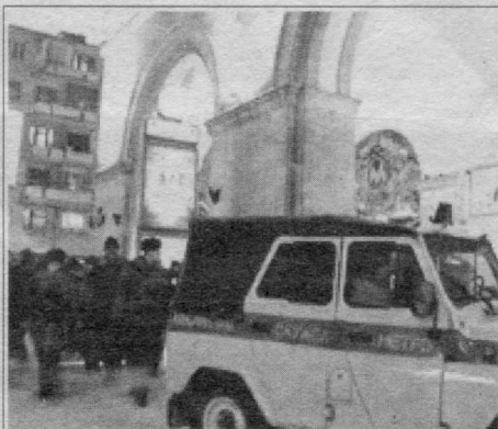
Ўтган душанба куни Москва метрополитенининг «Белорусская - Кольцевая» станицасида кучли портлаш рўй берди. Охириги маълумотларга кўра, мазкур қўпроқчилик ҳаракати натижасида 15 га яқин одам қурбон бўлган.

Америкаликларнинг бундай катта ишга қўл урганликлари, россиялик ҳарбий олимлари ҳам улкан ишларга ундамоқда. Рус ҳарбийлари самоддаги ҳуқуқронлиги осонликча бой бермасликларига шубҳа йўқ, лекин давлат уларни етарли маблағ билан таъминлай олармикан?