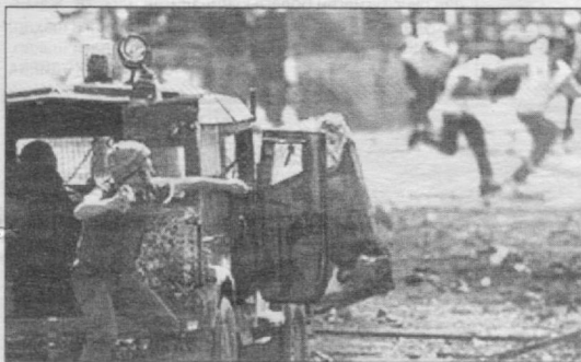
Суратда: Фаластин - Исроил: Кўча тўқнашувлари.

Ўзбекистон Республикаси Ҳарбий прокуратураси жамоаси Республика Ҳарбий суди раиси, адлия полковниги Т.Мирзаевага укаси Рустам МИРЗАЕВ нинг бевақт вафот этганлиги муносабати билан чуқур таъзия изҳор этади.