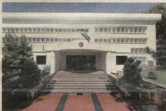
Ўзбекистон Республикаси Бош прокуратурасида Бош прокурор Р.Ҳ.Қодиров раислигида кенгайтирилган ҳайъат мажлиси бўлиб ўтди.

Саидлазиз САИДКАРИМОВ, Бош прокуратура бошқарма катта прокурори