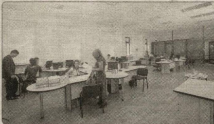
виқот ишлари кучайтирилди.

Аҳоли омонатларининг миқдори 2013 йил 1 январь ҳолатига 26,2 млрд. сўмни ташкил этди ва йил бошига нисбатан 3,3 млрд. сўмга ёки 14 фоизга оширилди.