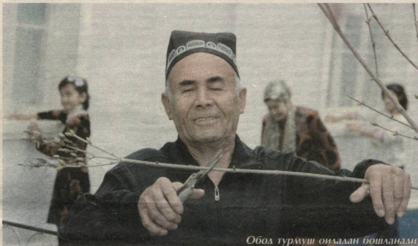
Обод турмуш оилалар бошланади