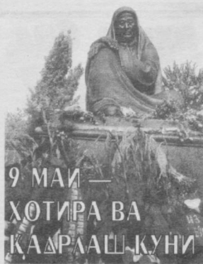
9 МАЙ — ХОТИРА ВА КАРАШ КУНИ