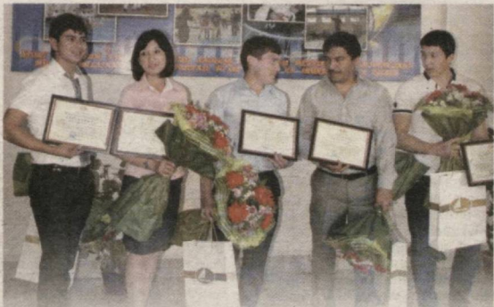
"Асака" давлат-акциядорлик тижорат банки томонидан Тошкент шаҳар Сергели туман ҳокимияти ва прокуратураси билан ҳамкорликда "Обод турмуш йили" Давлат дастури доирасида касб-хунар коллежлари битирувчиларини тадбиркорлик фаолиятига жалб этиш бўйича анжуман ўтказилди.

Анжуманда "Асака" банк, Тошкент шаҳар Сергели туман ҳокимияти ва прокуратураси масъул ходимлари, Сергели туманида жойлашган касб-хунар коллежлари битирувчилари, тадбиркорлик фаолияти билан шуғулланиш истагида бўлган ёшлар ва оммавий ахборот