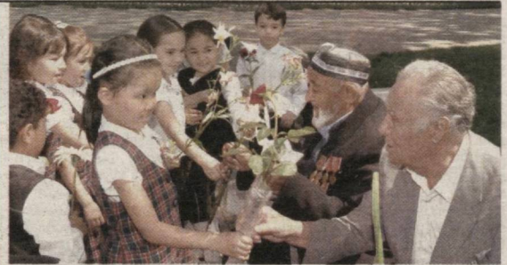
Мамлакатимизда нуруний отахон ва онахонларни ижтимоий ҳимоя қилиш, улар учун муносиб турмуш шароитини яратишга алоҳида эътибор қаратишмоқда. «Хотира ва қадрлаш куни» муносабати билан Иккинчи жаҳон уруши қатнашчиларини ҳар томонлама қўллаб-қувватлаш, уларнинг ҳолидан хабар олиш эзгу анъанага айланган.

Ўзбекистон Республикаси Вазирлар Маҳкамаси ҳузуридаги Вояга етмаганлар ишлари бўйича комиссия