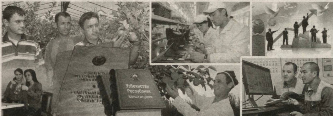
[Давоми. Бошланиши 1-бетда]

В илоятда 2012 йилда 56 та янги хорижий инвестиция корхоналари рўйхатга олинди, 2013 йил 1 январь ҳолатига жами корхоналар 465 тани ташкил қилади. Ўзбекистон Республикаси Президентининг 2011 йил 30 декабрдаги "Товар ва хизматларнинг 2012 йилга экспорт прогнози тўғрисида"ги Қарорига асосан вилоят ҳудудий экспорт дастурига киритилган корхоналар томонидан 310,1 млн. АҚШ доллари қийматида маҳсулот экспорт қилиниб, режа 105 фоизга бажарилиши таъминланган ва экспорт қилинган маҳсулотларнинг 108,8 млн. АҚШ доллари қўшма корхоналар ҳиссасига тўғри келган.