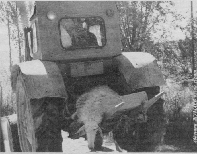
— Биз ҳам тўйга кетаялмиз

Уни тўрга тушириш учун мутахассислар уч кеча-ю уч кундуз овора бўлишган. Маҳаллий аҳолининг айтишича, кейинги йигирма йил ичида Викториа кўлида балиқ овлаган 83 киши бу тимсоҳга емиш бўлган эмиш. Ёши тахминан 60 ларда бўлган бу одамхўр тимсоҳ ҳозирги кунда тимсоҳлар учун қурилган махсус фирмада сақланмоқда.