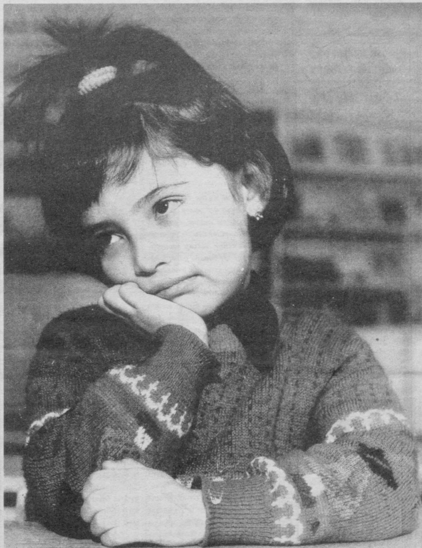
«Кўп ўқишим керак!.. I