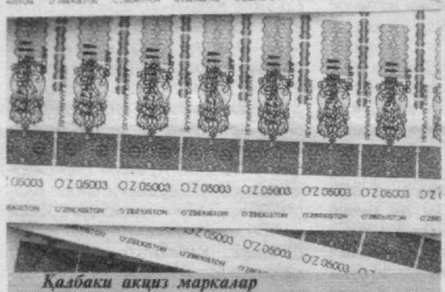
Қалбаки акциз маркалар

Республика Бош прокуратураси хузуридаги СВОЖКК департаменти ходимлари ана шундай сифатсиз ичимликларни четдан келтириб сотишга барҳам бериш, яроқсиз алкоғоли ичимликларни ишлаб чиқарувчи яширин цехларни фош этиш борасида бир қатор ишларни амалга оширмоқда. Хусусан, жорий йилнинг ўтган даври мобайнида 329 та шундай ҳолат аниқланиб, контрабанда йўли билан республикамизга олиб келинган, акциз маркасиз ва яширин цехларда тайёрланган маҳсулотлар, этил ва техник спирт ашёвий далил сифатида олиб қўйилди. Шу ўринда бир савол туғилди: ароқ ишлаб чиқаришда қўлланганидан спирит давлат монополиясига олинган бўлса, айрим фуқаролар қўлбола ускуналарда шароб ишлаб чиқариш учун хомашёни қаер-