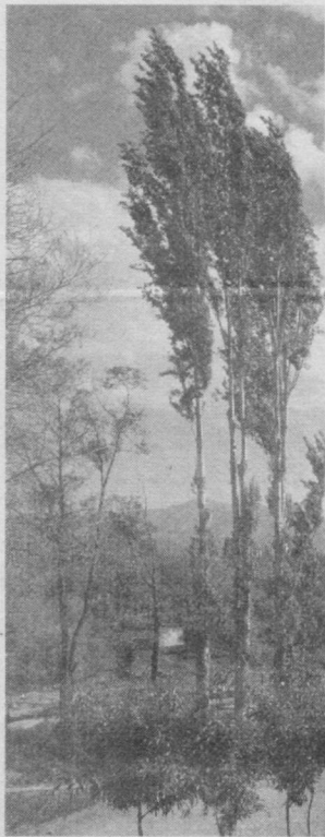
(Давоми. Бошланғичи I-бетда).

Бундан ташқари маҳалла оқсоқоллари ва маҳаллий аҳоли билан учрашувларимдан келиб чиққан ҳолда қурбонлар сони тахминан 170 га яқинлигини айтишим мумкин. Мен воқеа қурбонлари келтирилган асосий шифохонада ҳам бўлиб, у ердаги врачлар билан ҳам гаплашдим. У ердаги моргда бўлдим. Бироз кеч келганимиз сабабли морг ходимлари йўқ экан. Лекин шунга қарамастан бинони кўздан кечирдим. Биласизми, кичкинагина морг биносига матбуотда келтирилган қурбонларни сиғдиришнинг ҳеч иложи йўқ. Мен терговчи эмасман, лекин шунга қарамай, сўраб билган маълумотларимга қараганда яна қайтариб айтманки, қурбонлар сони 170 га яқин. Ундан кўпроқ бўлиши мумкин эмас.