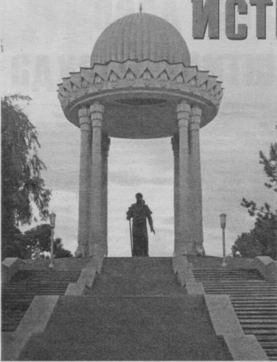
/Давоми. Бошланиши 1-бетда/

Ш унда мен бир савол берганимда, кўнгилдагидек жавоб ололмадим.