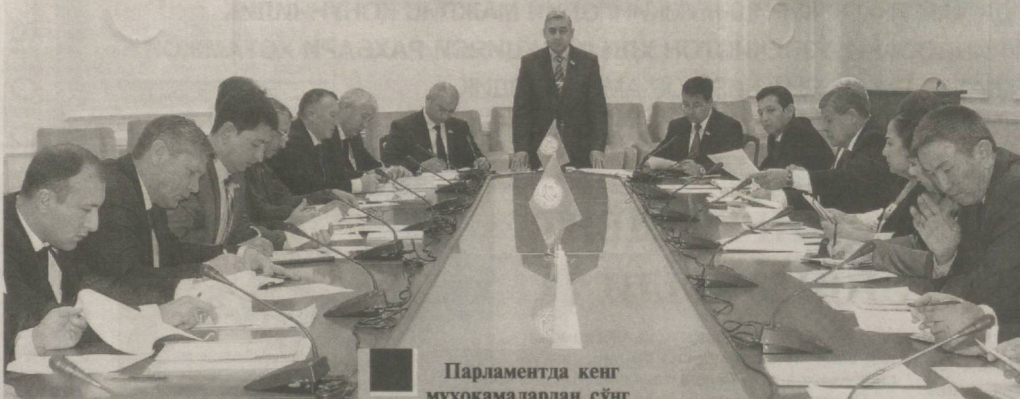
Парламентда кенг муҳокамалардан сўнг қабул қилинган «Аҳолининг санитария-эпидемиологик осойишталиги тўғрисида»ги, «Дори воситалари ва фармацевтика фаолияти тўғрисида»ги Ўзбекистон Республикаси Қонунига ўзгартиш ва қўшимчалар киритиш ҳақида»ги, «Жисмоний тарбия ва спорт тўғрисида»ги (янги тахрирда) қонунларда фракциямиз томонидан билдирилган бир қатор принципиал тақлифлар ўз аксини топганини айтиш ўринлидир.

«Ўзбекистон овози» мухбири Тўлқин ТўРАХОНОВ суҳбатлашди.