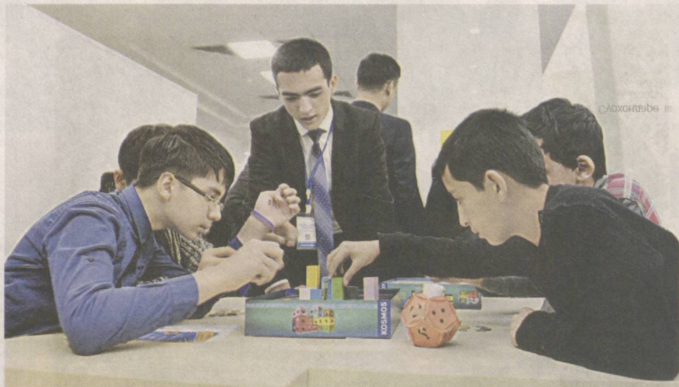
Ушбу оғлан сураётган.

Болаларда интеллектуал салоҳиятнинг ошиши ҳамда фикрлаш қобилияти шаклланиши учун аввалмбор уларни математика фанига қизиқтириш зарур. Бу ҳақиқатни олимлар кўп бора таъкидлаган. Бола математика фанига қанча эрта қизиқса, бу унинг ўқишига ижобий таъсир кўрсатади.