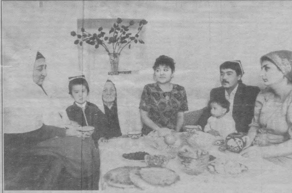
Эй, фарзанд, яхши хулқ, эзгу ният бахту саодат соҳиби бўлай десанг, меҳрибон волидангинг, муҳтарам бовижонинг айтган панду насиҳатларини қалбингга жойлаб ол!

Мамлакатимиз фуқароларининг виждон эркинлиги борасидаги конституциявий ҳуқуқларини таъминлаш, муборақ ҳаж амалларини адо этишда қулайликлар ва зарур шароитларни яратиш мақсадида Ўзбекистон Республикаси Вазирлар Маҳкамасининг «Муборақ ҳаж зиёратига борувчилага ёрдам кўрсатиш ҳақида»ги Қарори қабул қилинди.