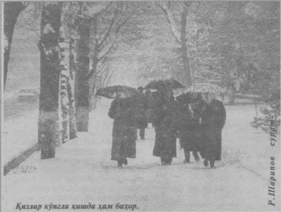
Қизлар кўнгли қишда ҳам баҳор.