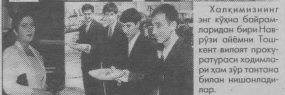
Суратда: Байрам таътаналаридан лавҳалар.