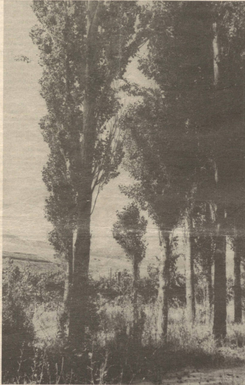
Р. АЛЬБЕКОВ сурати

Ҳамкасбларимизни мукофот билан чин дилдан қўлаймиз.