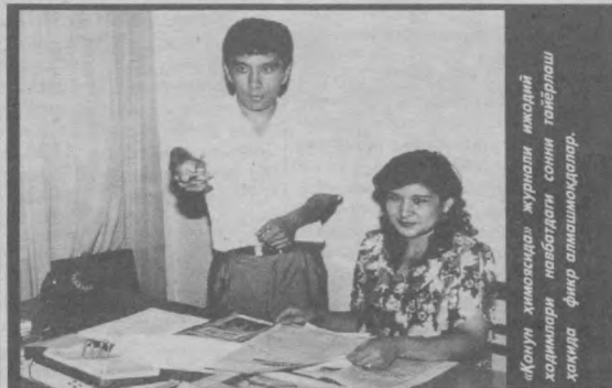
«Қонун химоясида» журнали ижодий фаолиятини химоя қилиш тўғрисидаги қонуннинг қабули билан журналистларнинг ҳуқуқлари мустақиллик ва эркинликка эришишига эришилди.

1996 йил Республика прокуратураси муассислигида «Қонун химоясида» журнали чоп этила бошлаганда, унинг келажаги порлоқ бўлишига кўпчилик ишонч билдирганди. Чунки, етилган шарт-шaroит, халқимизнинг ҳуқуқий наشرларга бўлган эҳтиёжи бунга асос бўла олди. Тахририятнинг ёш жамоасидан прокуратура ходимлари, малакали журна-