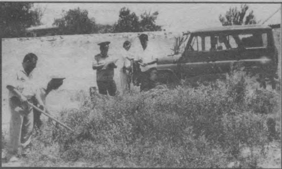
Суратда: Сирғали туман прокуратураси ва ички ишлар бўлими ходимларининг ҳамкорликдаги рейди.