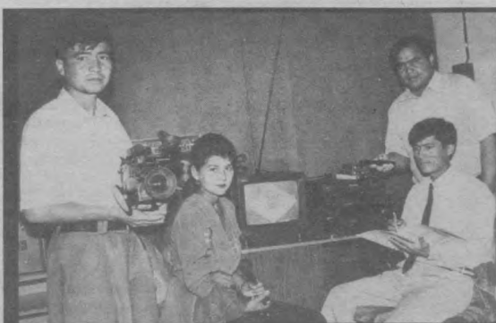
Сўрагдa: Сурхондарё вилоят ҳуқуқ-тартиб идораларининг «Адолат» телевидениеси ижодкорларидан бир гурӯҳи.

Ҳадемай, байрам! Ҳар бир ижодий жамоа байрам кунлари эришган ютуқларидан фaхрланади. Бой берилган имкониятларнинг сабабларини қидироди. Аммо, ҳар бир газета, ҳар бир кўрсатув ва эшиттириш қанчалар журналистларнинг умрини «эгов»лаш ҳисобига дунёга келишини ҳамма ҳам билавермайди. Байрам баҳона бу қийин касбнинг қаттиқ, аммо ширин номини еяётган бора касбдошларимизнинг оиласига омонлик, ўзларининг қалбини ижодий қувончлар тарқ этмаслигини тилаб қоламиз.