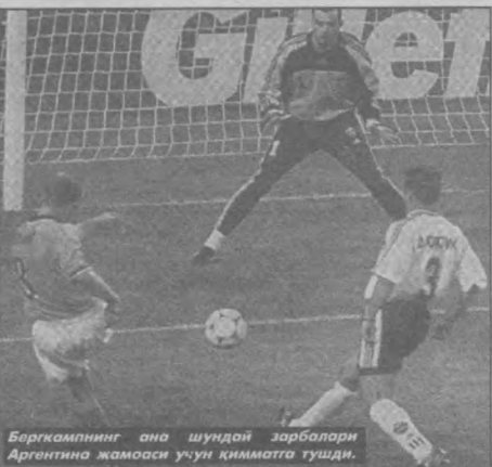
Бергкамплнинг ана шундай зарбалари Аргентина жамоаси учун қимматга тушди.