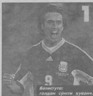
Батистута: голдан сўнгги кувонч.