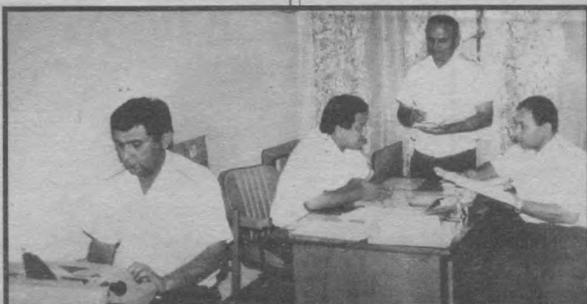
Пойтахт прокуратурасининг умумий назорат бўлимида иш доим қизғин. Бироқ, ходимлар тез-тез йиғилиб долзарб муаммоларни муҳокама қилишга ҳам вақт топади.