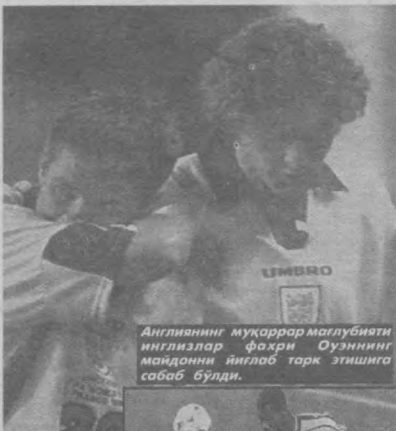
Англиянинг муқаррар мағлубияти инглизлар фахри Оуэнинг майдонни ййглаб тарк этишига сабаб бўлди.