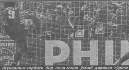
Шужернинг зарбаси бир неча сония ўтмай дарвоза тўрига теғди.