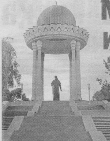
Давоми. Бошланиши 1-бетда/

Навоий дунёқарашда адолат бутун мамлакатга тааллуқли бўлиб, одил подшоҳнинг фаолияти туфайли мамлакат бойи-ди, халқ тўқ ва фаровон турмуш кечиради. Навоий шундай деб ёзади: "У (подшоҳ) ҳамма кентларни осойишталигини таъминлайди ва обод қилади. Кўёш нурлари ва баҳор бутуллари каби ниҳолларни ер бағридан ўстириб чиқаради. Ўз фуқароларини мисли кўрилмаган даражада саҳийлик билан олтин ва марваридларга кўмиб ташлайди. Унинг муруввати ва саховати билан бечораю мискинлар жабр кўрмайдилар".