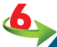
“Inkuzart” телеграм каналидан олинган расм. Изоҳ ўзингиздан...