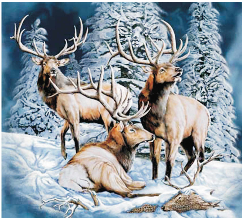
Суратдан 8 та буғу тасвирини топишга ҳаракат қилинг.