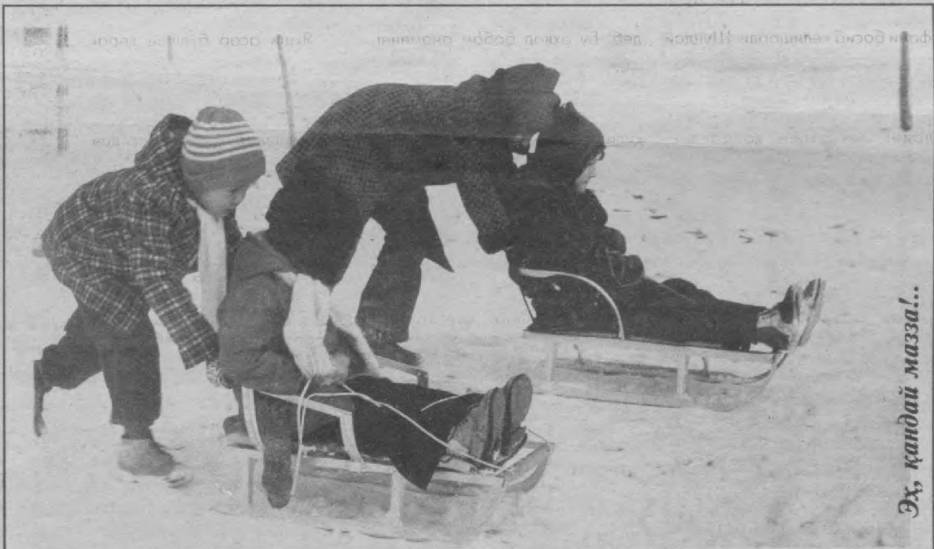
Эх, қандай мазза!..

Энига: 3. Иштихон. 7. Итузум. 8. Золим. 9. Илтижо. 12. Фоҳиша. 13. Она. 16. «Фантомас». 17. Руанда. 22. Нота. 25. «Уфк». 26. Йог. 27. Иод. 28. Икар. 29. Ишқ. 31. Ошно. 32. Гран. 33. Тигра. Бўйига: 1. Эталон. 2. Из. 3. Имзо. 4. Тилло. 5. Хум. 6. Нон. 10. Ип. 11. Ишоат. 12. Фанта. 13. Осмон. 14. Август. 15. Ифр. 18. Урганч. 19. «Найк». 20. «Ауди». 21. Ақиқ. 23. Оскар. 24. Айрон. 30. Шер.