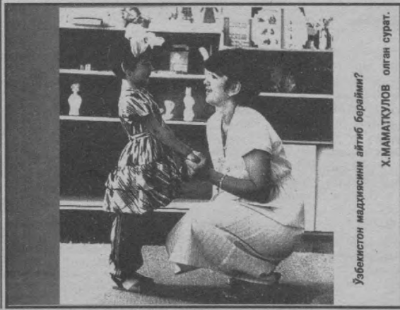
Узбекистон маҳкисини айтиб берарми?

- Билмадим. Кўплар учун улларнинг ўзлари улғайиб қолгандек туюлар. Лекин бунинг учун йиллар керак бўлди. Мен улларга меҳр бердим. Болаларини меҳнатта, мустақил ҳаракат қилишга ўргатдим. Бор гап шу.