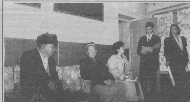
Ўзбекистон Республикаси прокуратурасининг қабулхонаси.